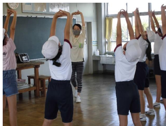
エアロビ体操クラブ