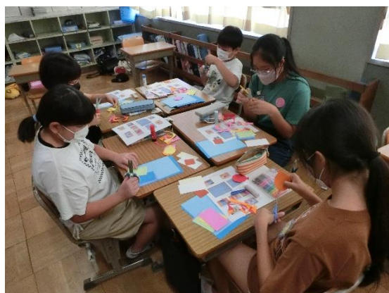
ペーパークラフトクラブ